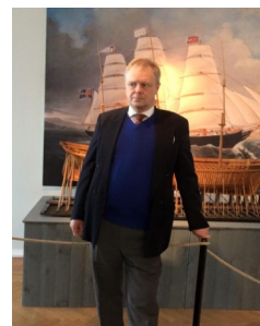
Foto: Olof Nimhed visar Västerviks museum.

Under eftermiddagen informerades de medverkande om vad som gäller inför Arkivens dag.