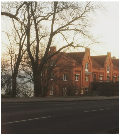
Foto: Oskarshamns stadshus 2015.

Kontaktuppgifter: Kalmar läns Arkivförbund Box 705 572 28 OSKARSHAMN Tel: 0491-880 32 E-post: klaf@oskarshamn.se, karin.lokrantz@oskarshamn.se www.arkivkalmarlan.nu