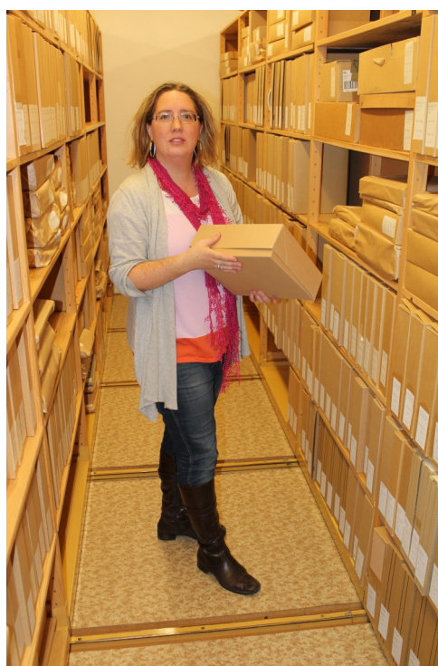
Foto: länsarkivarien i Folkrörelsearkivet för mellersta Kalmar läns arkivlokal 2012. Fotograf: Johan Teiffel

Kalmar läns Arkivförbund (KLAF) är en samarbetsorganisation för arkiv och arkivhantering i Kalmar län.