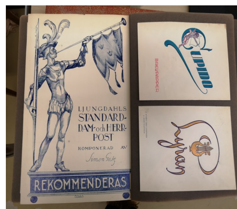
Brevpapper Ljungdahls arkiv.

Kommunarkivet var här tvungna att göra ett urval eftersom man inte har möjlighet att ta emot hela arkivet.