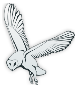
Kalmar läns Arkivförbund